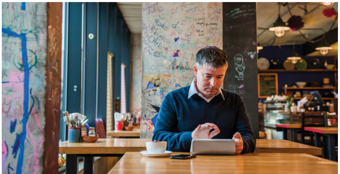
1. « Mobile BI: Portable Firepower for Lineof - Business Insight », Aberdeen Group, 2014.

Dans 68 % des cas, les performances de l'entreprise sont sensiblement améliorées, avec une accélération des signatures de contrat et une fidélisation accrue de la clientèle 1 . On estime aussi que l'implication des équipes commerciales est multipliée en situation de mobilité.